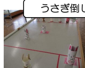
うさぎ倒しゲーム