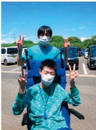
気持ちいい青空に🌤️