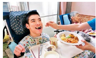
美味しくて笑顔が止まらない☆