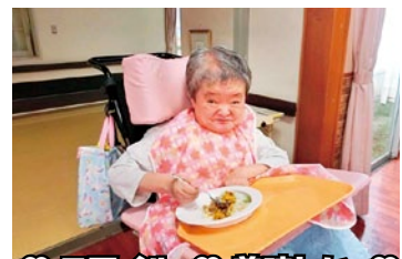
♡ スマイル ♡ 美味しい ♡